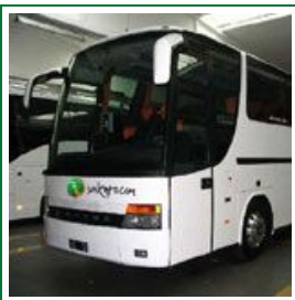
Gite scolastiche e visite d'istruzione nel Salento